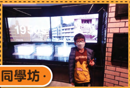
· 同學坊 ·